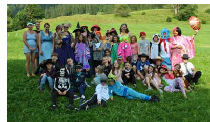
Kila

Das Zeltsommerlager (5. – 8. Klasse) wurde in Marly an der Sarine durchgeführt. Die Teilnehmenden haben an der Seite von Robin Hood für das Gute gekämpft und konnten so den bösen Prinz John vom Thron verjagen.